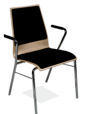
Armlehnen PVC A3