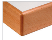
Buche massiv Kante