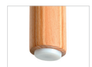
PVC od. Filzgleiter