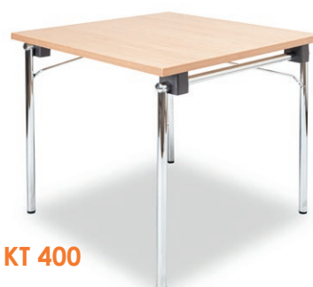
Kleiner KT 400