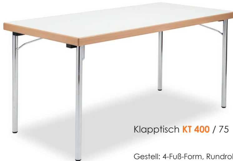
Klapptisch KT 400 / 75

Gestell: 4-Fuß-Form, Rundrohr 35 mm verchromt Kantenform 75