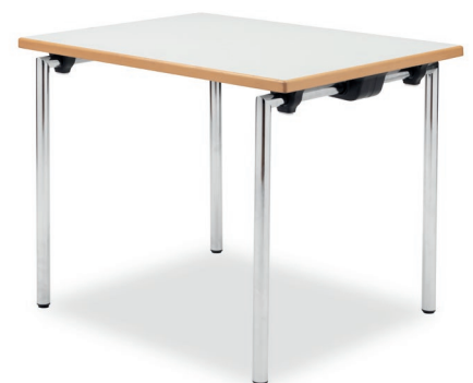
Kleiner KT 430